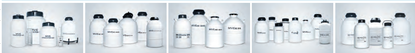
Сосуды Дьюара для хранения и транспортировки биоматериалов