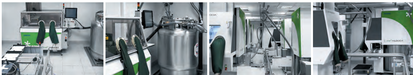
Роботизированный криобанк ASKION