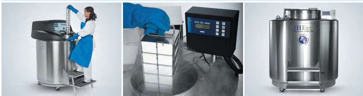
Криохранилища классического типа