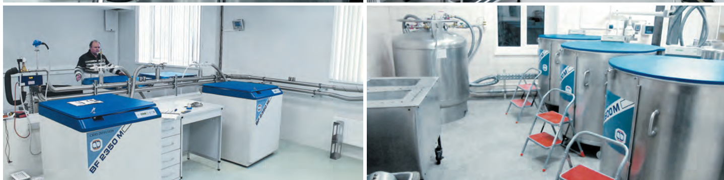
Примеры организации криобанков на базе классических криохранилищ