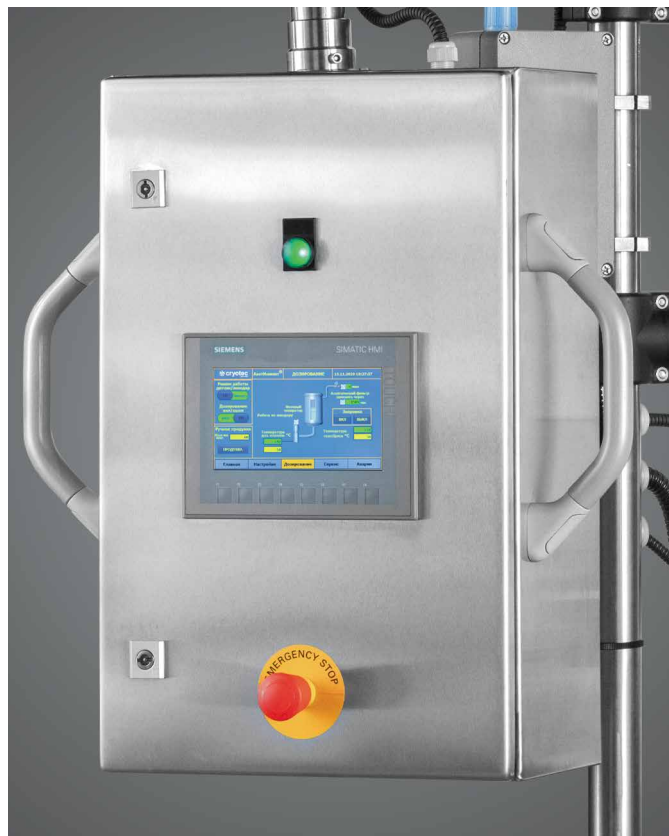
Шкаф управления дозатором ж/а с Touch Screen на базе Siemens Simatic S7-1200