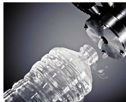
Впрыск жидкого азота на линии розлива на скорости до 45 000 бут/час